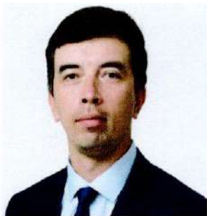
Главный судья (Руководитель гонки)