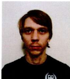
Офицер по связи с участниками