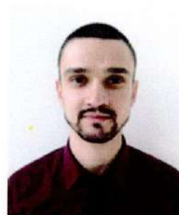
Старший судья бригады Парка Сервиса